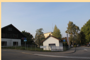
Areal Diakonie Nidelbad