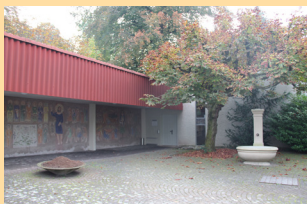
Eingang Gartenhalle Nidelbad